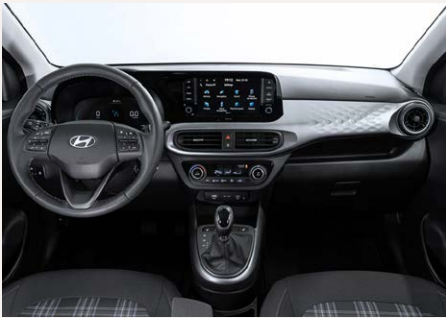
UML Purple belső (SACA01)