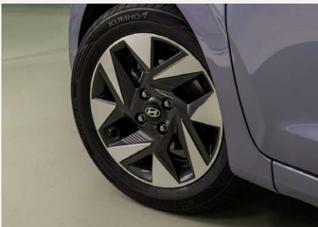
15"-os könnyűfém keréktárcsák