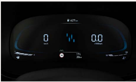
4,2"-os Supervision műszeregység