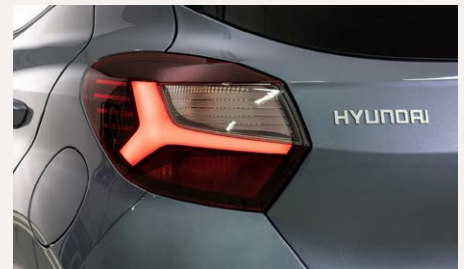
LED-es hátsó lámpák