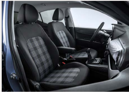
UML Purple belső (SACA01)