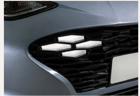
LED-es nappali menetfény