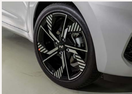
16"-os könnyűfém keréktárcsák