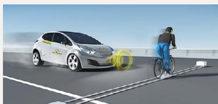
FCA kerékpárost felismerő mód