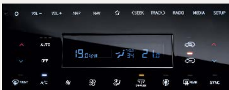
Kétzónás automata légkondicionáló