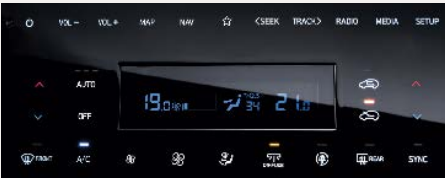
Kétzónás automata légkondicionáló