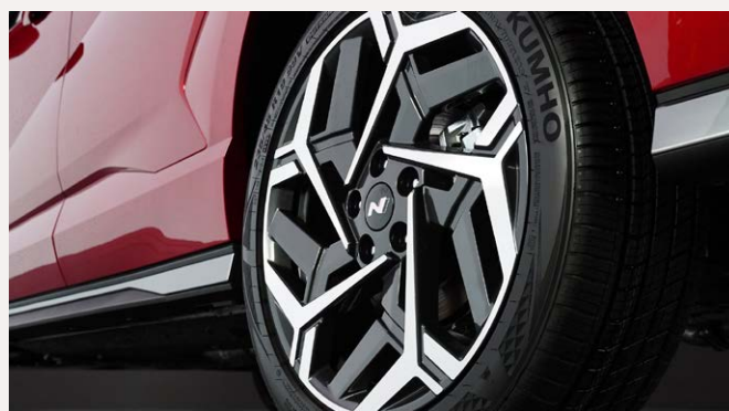
18"-os könnyűfém keréktárcsa (N-Line)