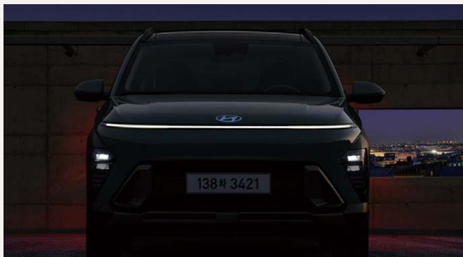
LED-es menetfény teljes szélességben elől-hátul