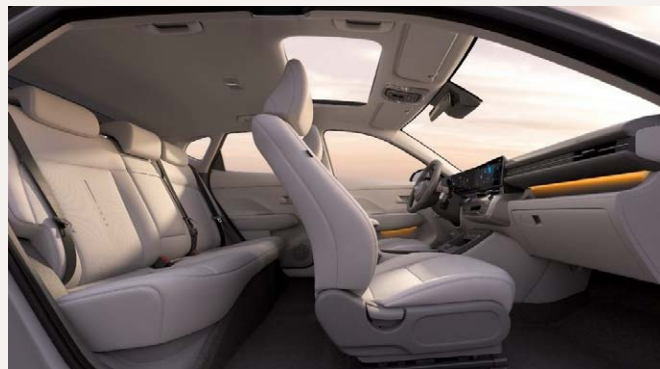
Vékony ülések és tágas belső tér