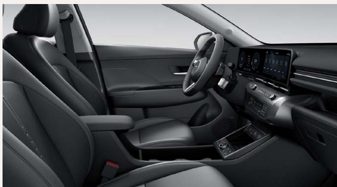
Black belső (NNB)