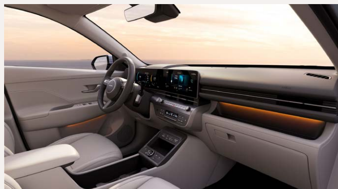
Gray belső (YPK)