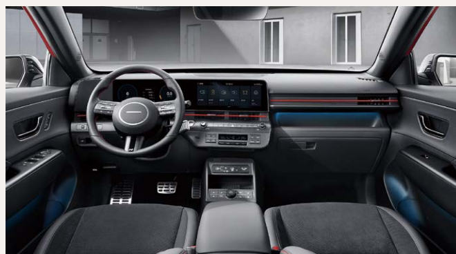
N-Line belső (HOT)