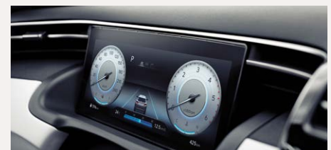
10,25" Supervision műszeregység