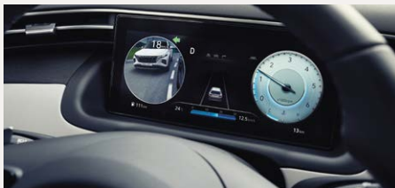
Holtterfigyelő monitor (BVM)