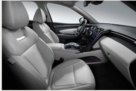
Gray belső (Bőr kárpitozás esetén) szövet kárpit esetén az ülések feketék