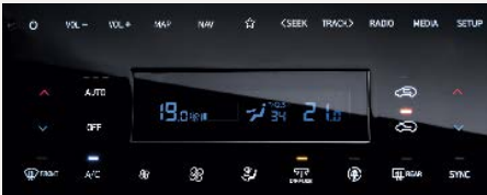
Kétfónás automata légkondicionáló