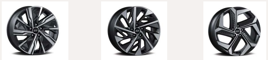
Keréktárcsa választék, balról jobbra: 17" alu - 18" alu - 19" alu