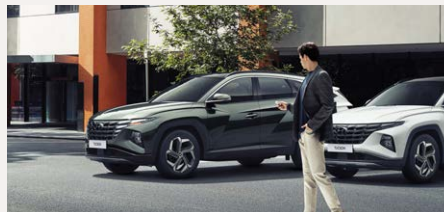
Távírányításos beparkoló rendszer