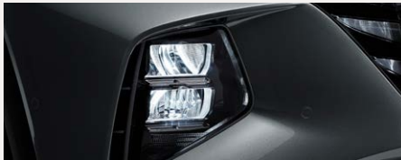
LED MFR fényszórók és rejtett DRL