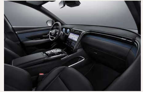
Teal belső (Comfortól)