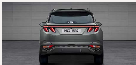
LED-es hátsó lámpák