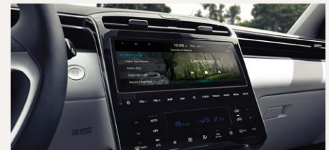
10,25" Navigációs rendszer