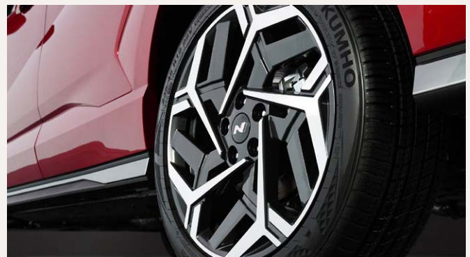
18"-os könnyűfém keréktárcsa (N-Line)