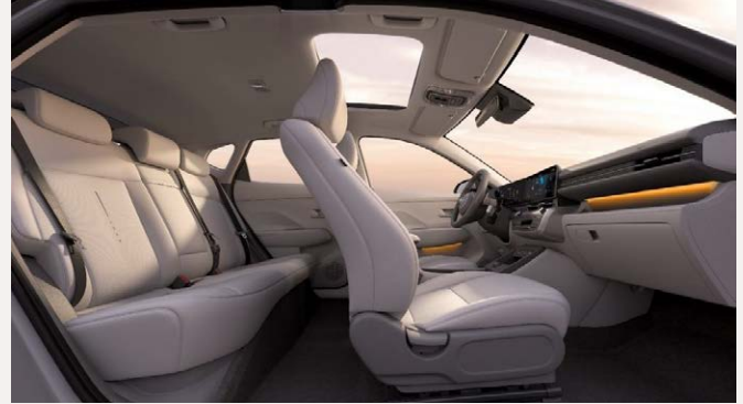
Vékony ülések és tágas belső tér