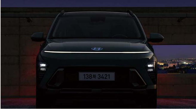
LED-es menetfény teljes szélességben elől-hátul