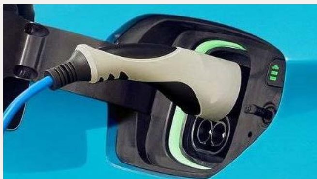
Fűthető elektromos töltőnyílás