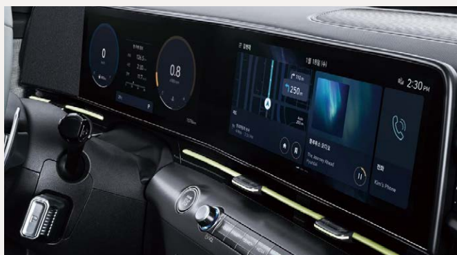
Dupla 12,3"-os kijelző