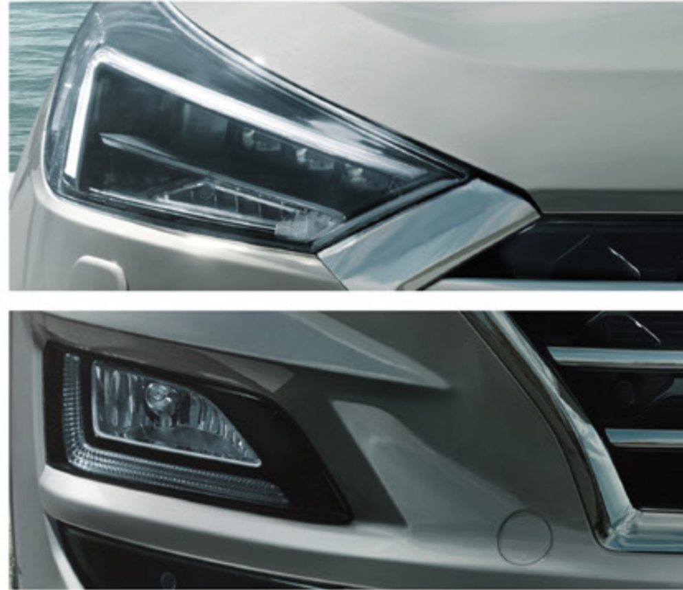
Új, full LED-fényszórók Intelligens távolsági fényszóró asszisztenssel