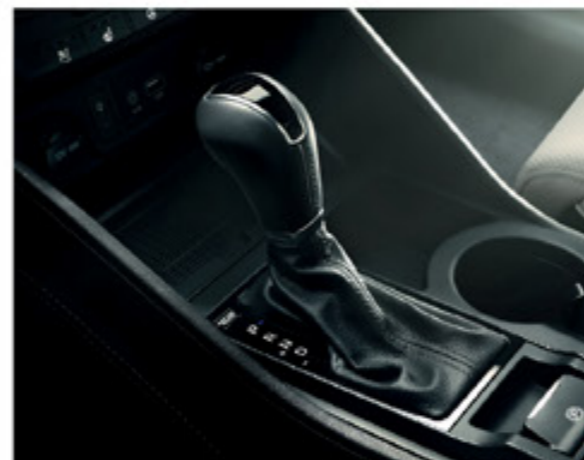
Hatfokozatú kézi sebességváltó; hétfokozatú duplakuplungos sebességváltó (DCT); nyolcfokozatú automata sebességváltó (AT).