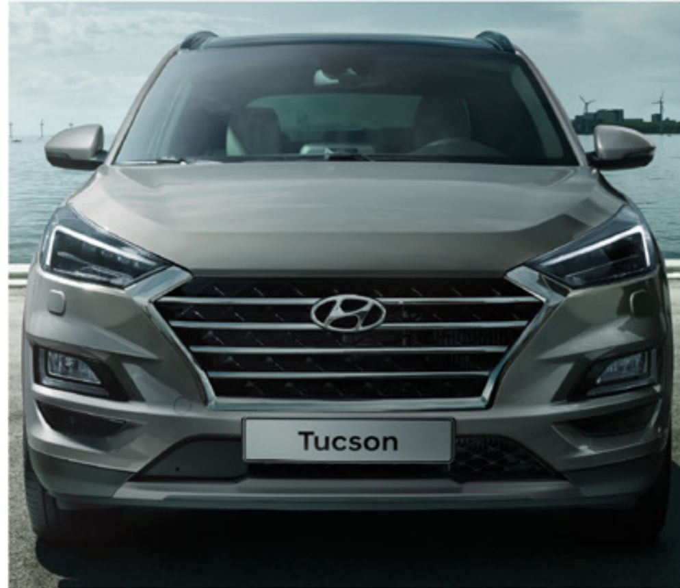
Mostantól a Hyundai márkajegyének számító kaszkád hűtőráccsal

A merész, új formai elemek széles választékának köszönhetően az új Tucson után megfordulnak az emberek.