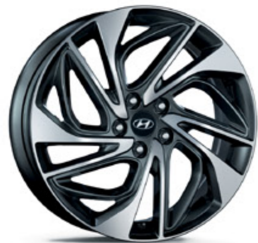
19 colos könnyűfém keréktárcsa