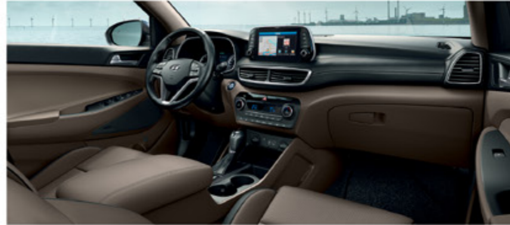
Sahara Beige kéttónusú