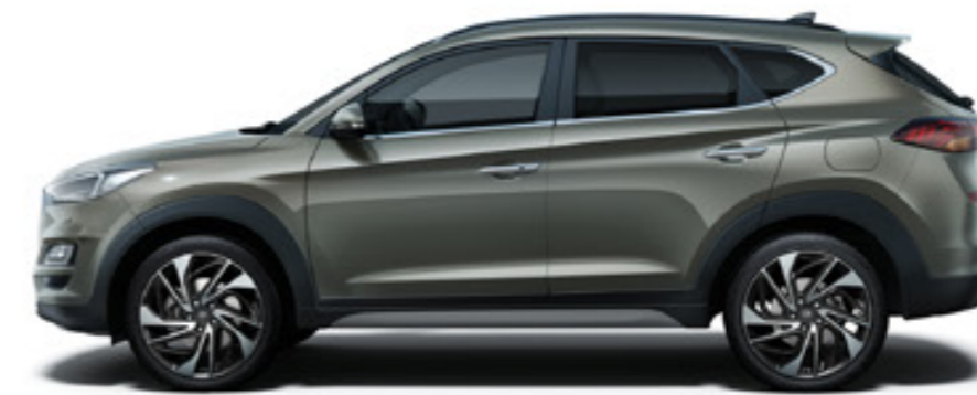
2670 mm 4480 mm