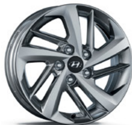
16 colos könnyűfém keréktárcsa