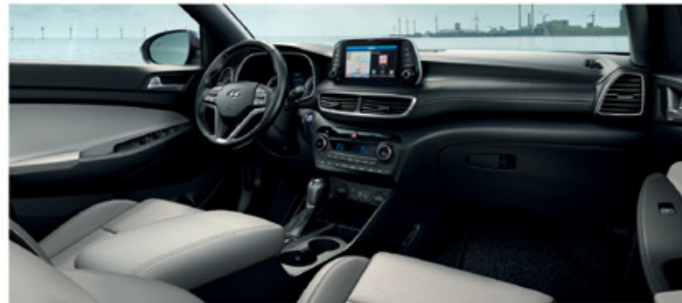
Fekete / Világoszürke