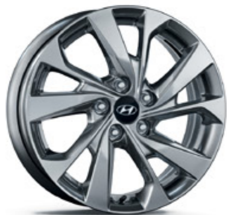
17 colos könnyűfém keréktárcsa