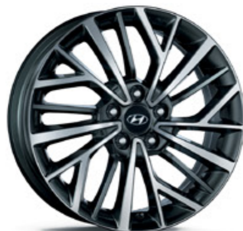
18 colos könnyűfém keréktárcsa (új)