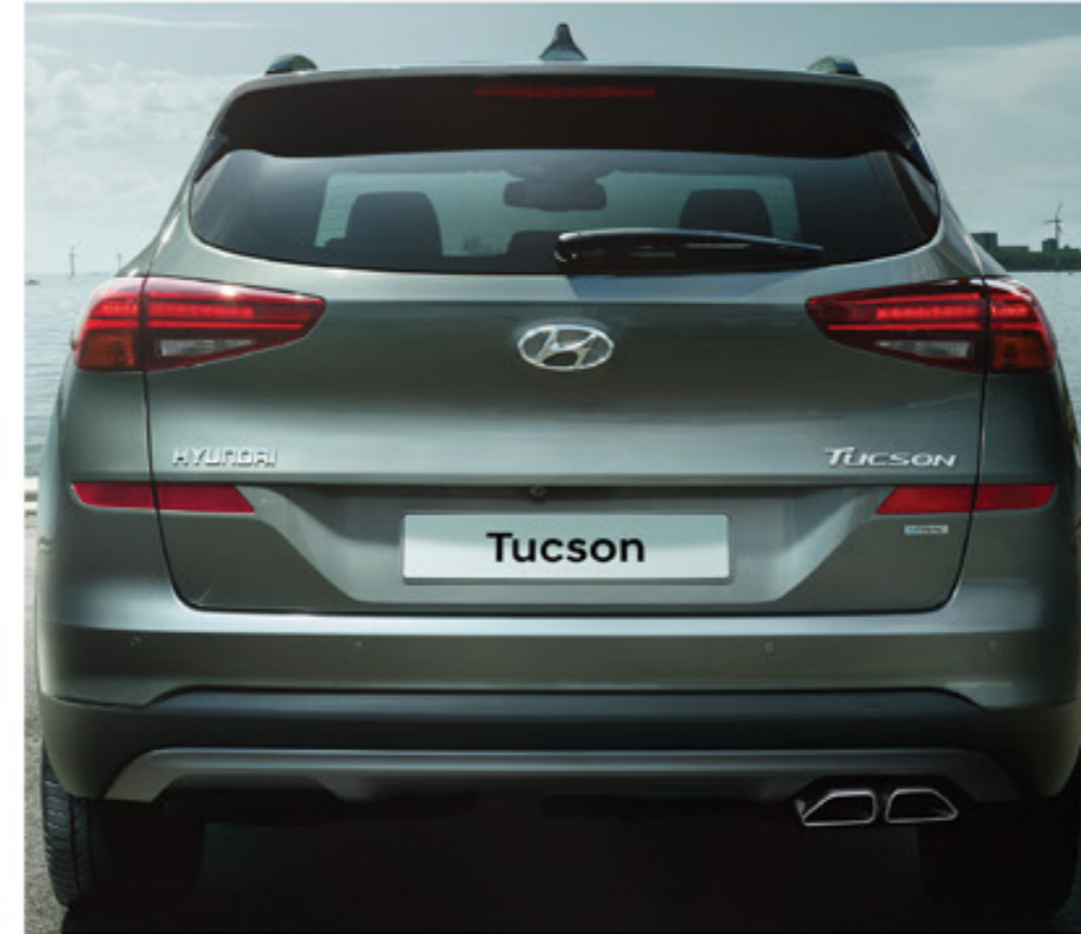
Újratervezett hátsó lökhárító és új LED-lámpák