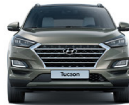
1604 mm 1850 mm