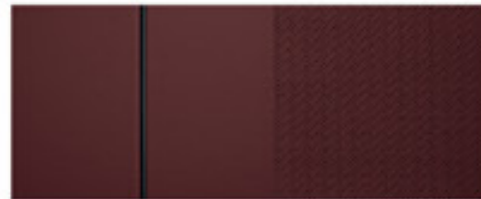
Red Wine bőr