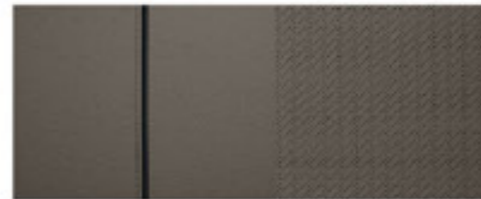
Sahara Beige bőr