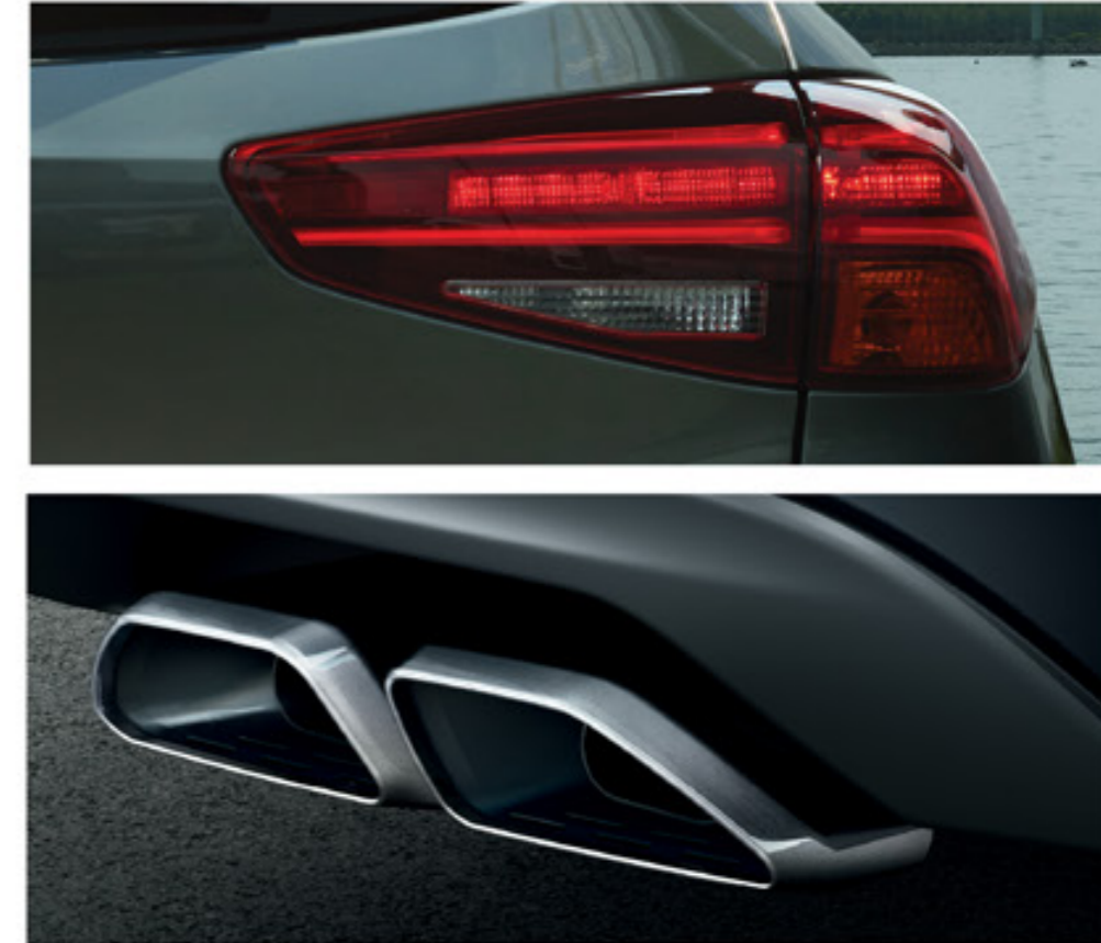
Új hátsó LED-lámpák és dupla, króm kipufogóvégek