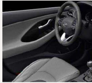
Pewter Gray - csak szövet