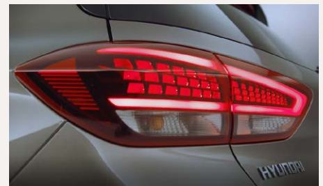
LED-es hátsó lámpatest