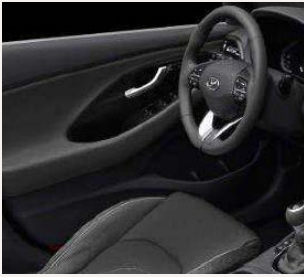
Oceanids Black - Bőr vagy szövet