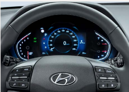
7"-os Supervision műszeregység