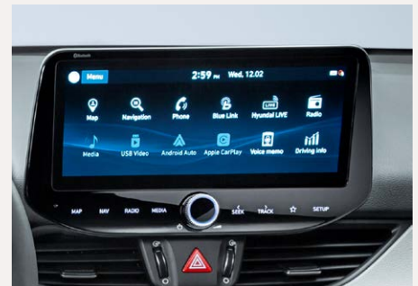
10,25"-os Navigációs rendszer