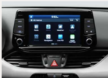
8"-os Display audiorendszer