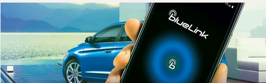
BlueLink telematika, csatlakoztatott gépjármű szolgáltatások - Kattintson a képre!