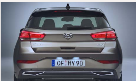
Króm betét a hátsó lökhárítón