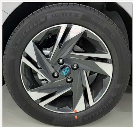
16"-os könnyűfém keréktárcsa