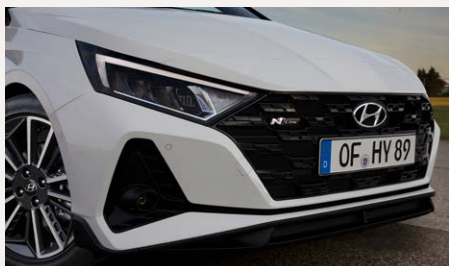
N-Line csomag - előlnézet