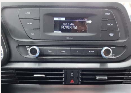
3,8"-os Integrált audio rendszer