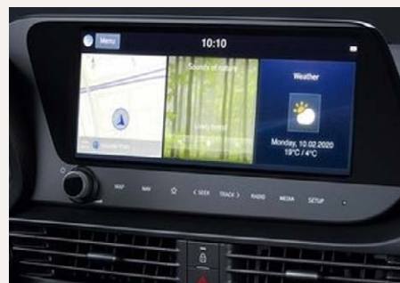
10,25"-os Navigációs rendszer