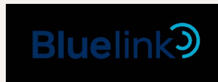
Bluelink telematika - kattintson!