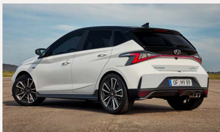
N-Line csomag - hátnézet