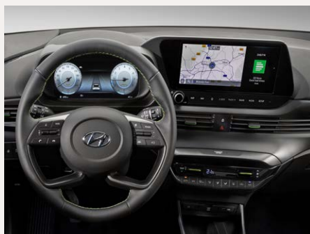
Supervision 10,25", és Navigációs 10,25" színes kijelzők