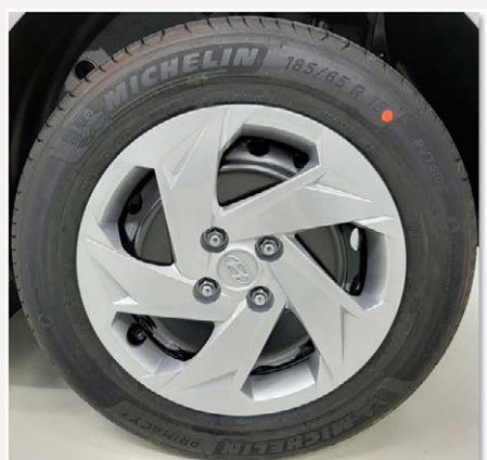
15"-os acélkerék díztárcsával