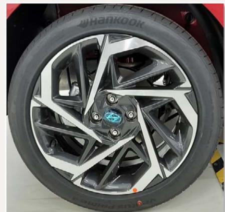
17"-os könnyűfém keréktárcsa