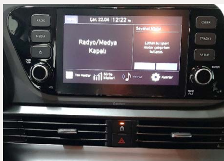
8"-os Display audio rendszer