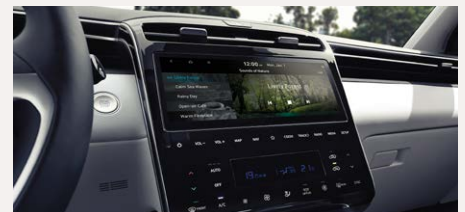
10,25" Navigációs rendszer