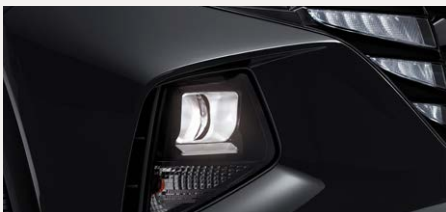
Halogén vetítőlencsés fényszórók