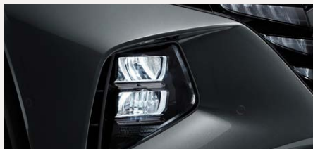
LED MFR fényszórók és rejtett DRL