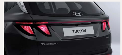
Sztenderd hátsó lámpa