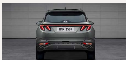
LED-es hátsó lámpák