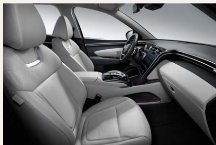
Gray belső (Bőr kárpitozás esetén) szövet kárpit esetén az ülések feketék