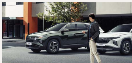
Távírányításos beparkoló rendszer