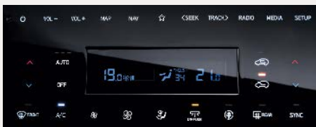
Kétfónás automata légkondicionáló