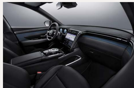
Teal belső (Comfortól)