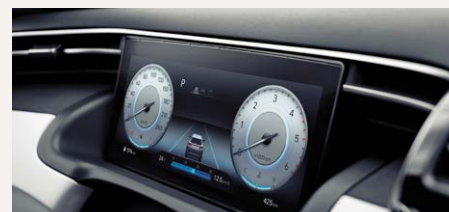
10,25" Supervision műszeregység