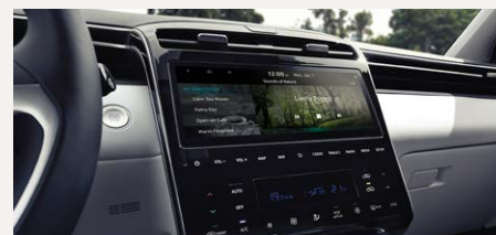
10,25" Navigációs rendszer