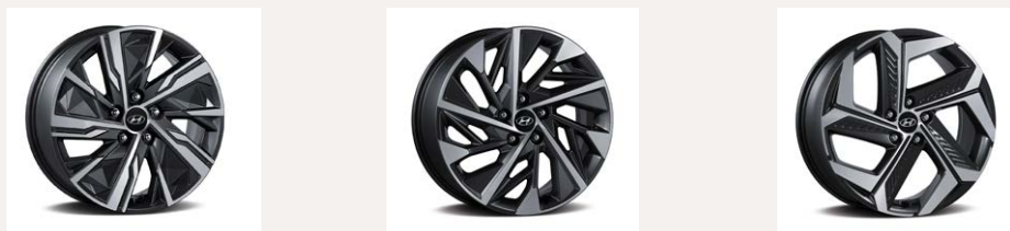
Keréktárcsa választék, balról jobbra: 17" alu - 18" alu - 19" alu