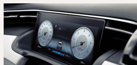
10,25" Supervision műszeregység