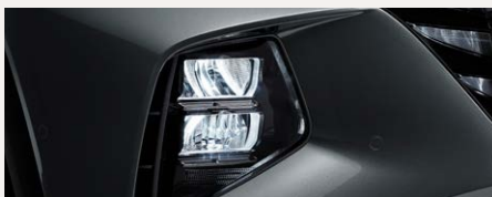
LED MFR fényszórók és rejtett DRL