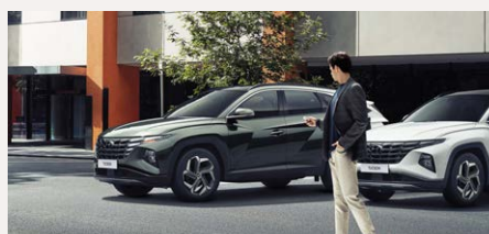
Távírányításos beparkoló rendszer