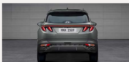
LED-es hátsó lámpák