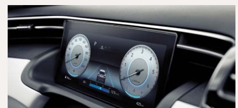
10,25" Supervision műszeregység