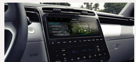
10,25" Navigációs rendszer