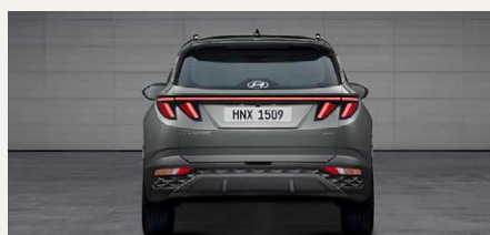
LED-es hátsó lámpák