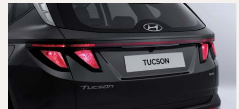
Sztenderd hátsó lámpa