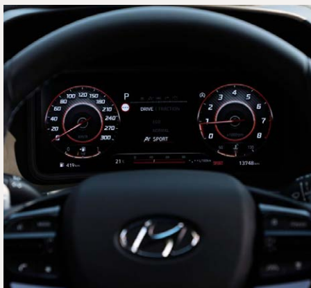
10,25" Supervision színes kijelző