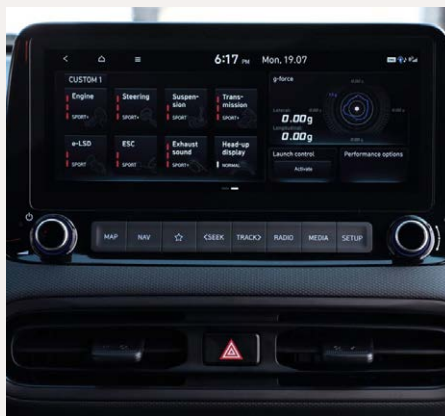
10,25" AVN színes kijelző