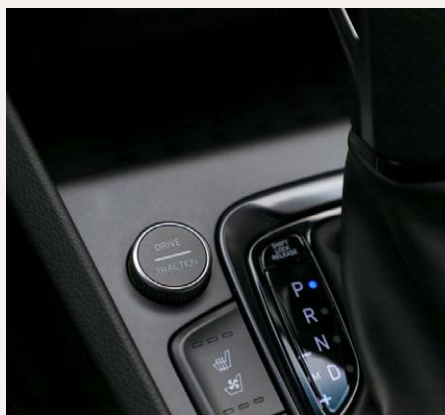
Üzem mód váltó kapcsoló Terep előválasztó gomb