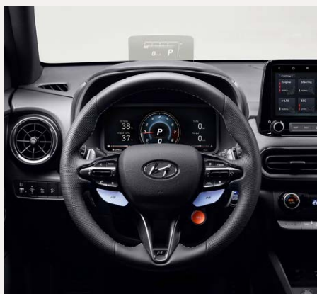
HUD - Head Up Display Sportos bőrkormány