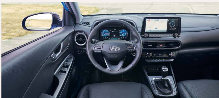
Belső megjelenés két 10,25"-os színes TFT kijelzővel