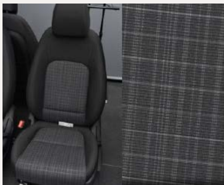
Prémium fekete szövet kárpitozás