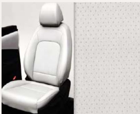
Light Beige bőr kárpitozás