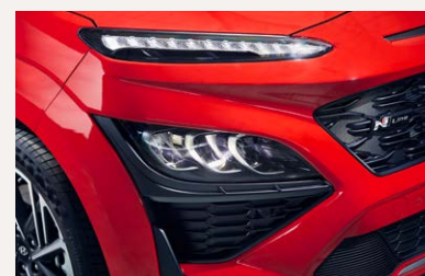
Full LED fényszóró - N-Line