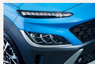
Full LED fényszóró