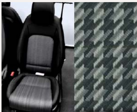
Fekete szövet kárpitozás