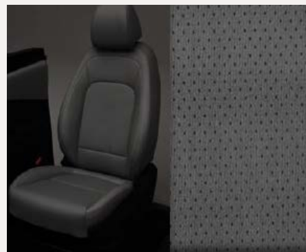
Fekete bőr kárpitozás