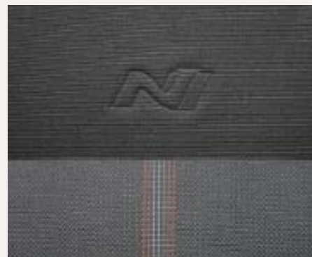
N-Line szövet kárpitozás