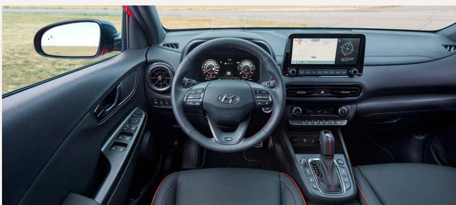
N-Line Belső megjelenés két 10,25"-os színes TFT kijelzővel