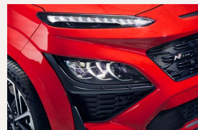
Full LED fényszóró - N-Line