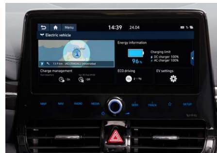
10,25"-os Navigációs rendszer