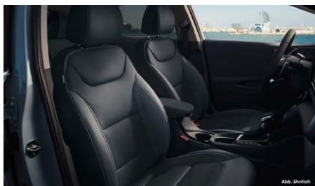
Fossil Gray (T9Y) belső