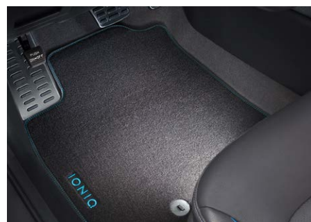
Velúrszőnyeg garnitúra - 25 200 Ft