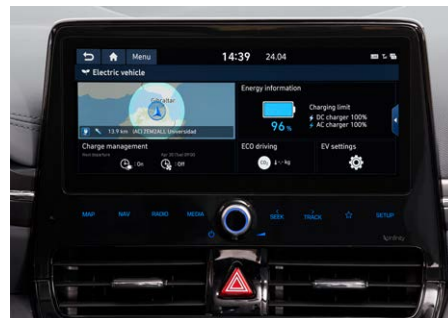
10,25"-os Navigációs rendszer