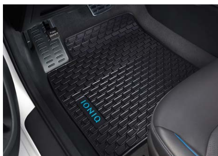
Gumiszőnyeg garnitúra - 23 200 Ft