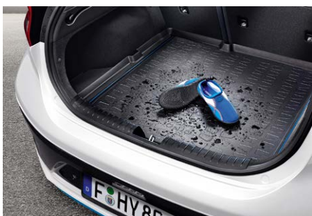
Csomagtértálca - 24 600 Ft