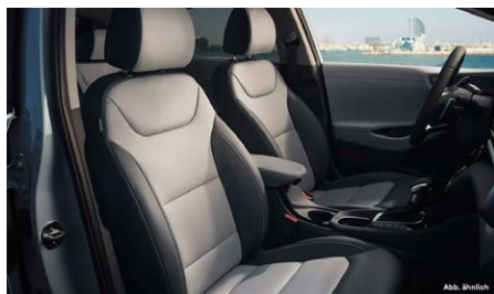
Shale Gray (YPK) belső