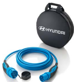
Gyári Type 2 egyfázisú töltőkábel - 137 990 Ft 99631ADE003A (5 m, 32A, 7,4kW)