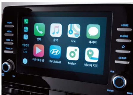
8"-os Display audio rendszer