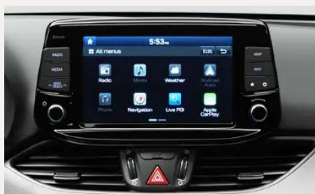
8"-os Display audiorendszer