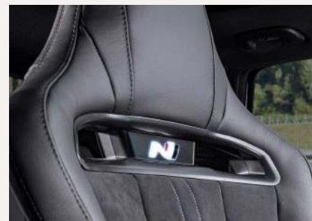
N option bőr/szarvasbőr könnyített ülés