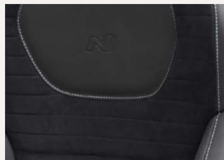
Bőr/ szarvasbőr kárpitozás