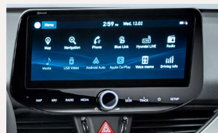
10,25"-os Navigációs rendszer