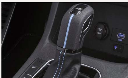
DCT váltó 8 sebességfokozattal

Főbb funkciók: Autó pozíciójának meghatározása, Ajtók nyitása / zárása távolról Megtett utak összegzése, elemzése, üzemanyagszint állása, Hibaüzenetek megjelenítése A funkciók sora a jövőben folyamatosan bővülni fog, a nem előkészített autók a későbbiekben nem kiegészíthetők.