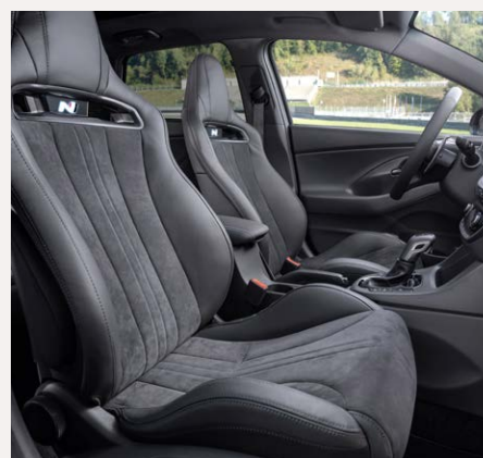
N option ülécscsomag