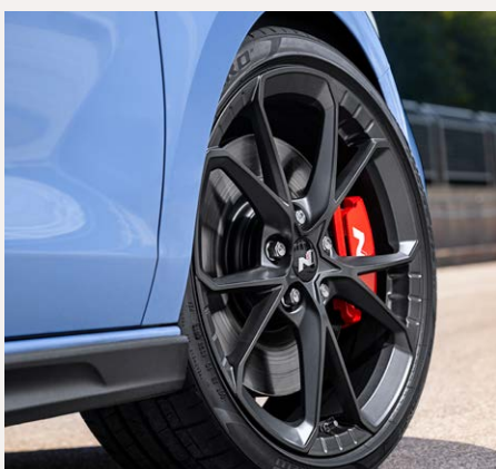
19" kovácsolt könnyűfém keréktárcsák